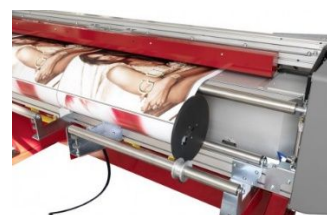
F Porte bobine intégré