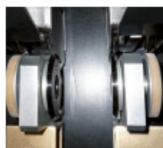
Couteaux double coupe réglable