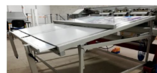
Table simple avec butée et 3 niveaux