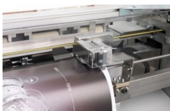
F Cellule de détection longitudinale