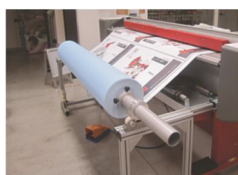
Dévidoir grosse bobine