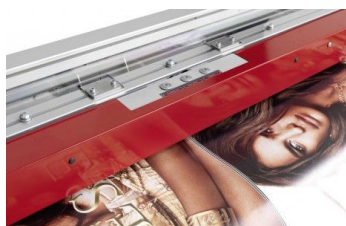
F Mode DIGITRIM