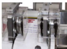
Couteaux simple et double coupe