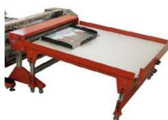
Table de tackage automatique